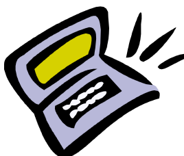
Légende accompagnant l'illustration.

Marie-Pierre fait ensuite état du rapport d'activité, - sorties - collaboration avec CIRCA- ateliers journal et arts plastiques - rencontre avec les membres de l'association Arc en ciel à Marmande, sortie au tour de France, etc... Au delà des activités déjà en place ( atelier arts plastiques, atelier écriture/journal), de nouvelles activités sont en train d'être mises en place en lien avec l'association de sport adapté, mais aussi avec le café associatif, les actions avec CIRCA seront aussi renouvelées. Des projet de sorties sont en cours de préparation, dans les Pyrénées notamment, (Cirque de Gavarnie, Parc d'Angelès Gazost,